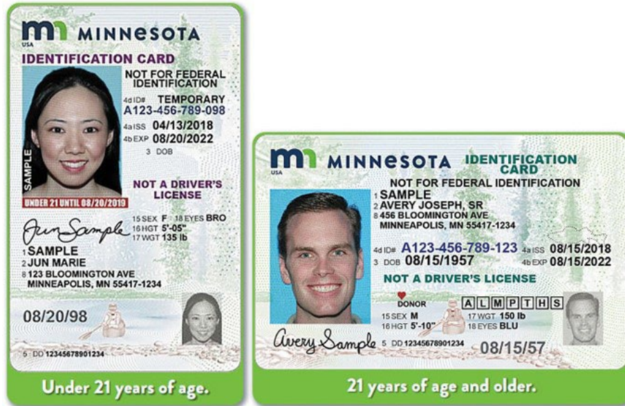
Kadi za Utambulisho za Minnesota

Kuna leseni zingine mbili zinazopatikana Minnesota: leseni zilizoreshwa na za Kitambulisho Halisi. Ili kupata leseni iliyoborehwa au ya Kitambulisho Halisi, mwombaji lazima athibitise uraia au hali ya uhamiaji inayostahiki.