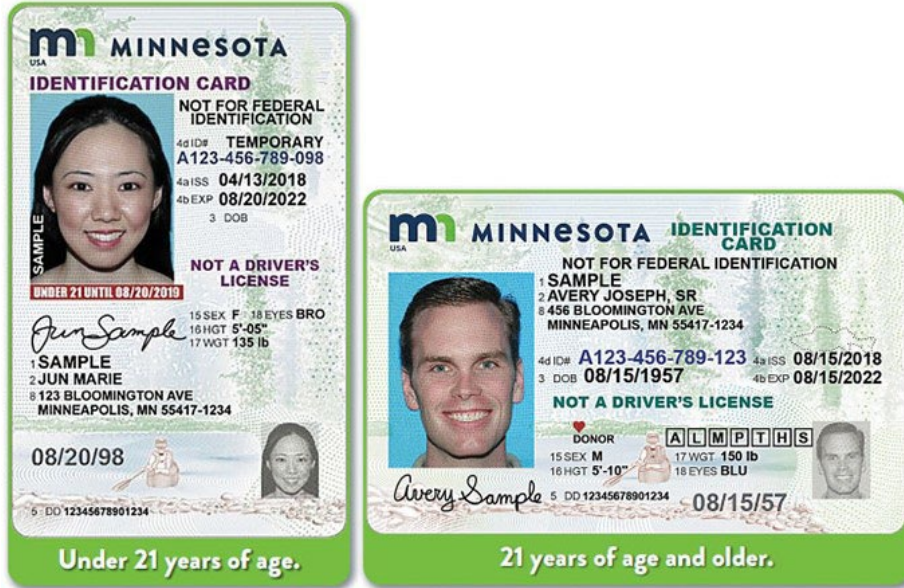
Minnesota တၢ်အုၣ်သး ခးက့တဖၣ်