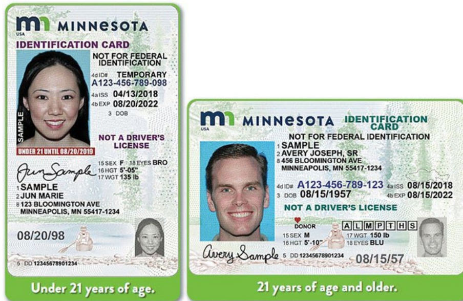
Посвідчення особи в Міннесоті

В Міннесоті існує два інших види посвідчень: розширені водійські права (EDL) та посвідчення Real ID. Щоб отримати розширені водійські права або посвідчення Real ID, заявник повинен підтвердити своє громадянство або імміграційний статус.