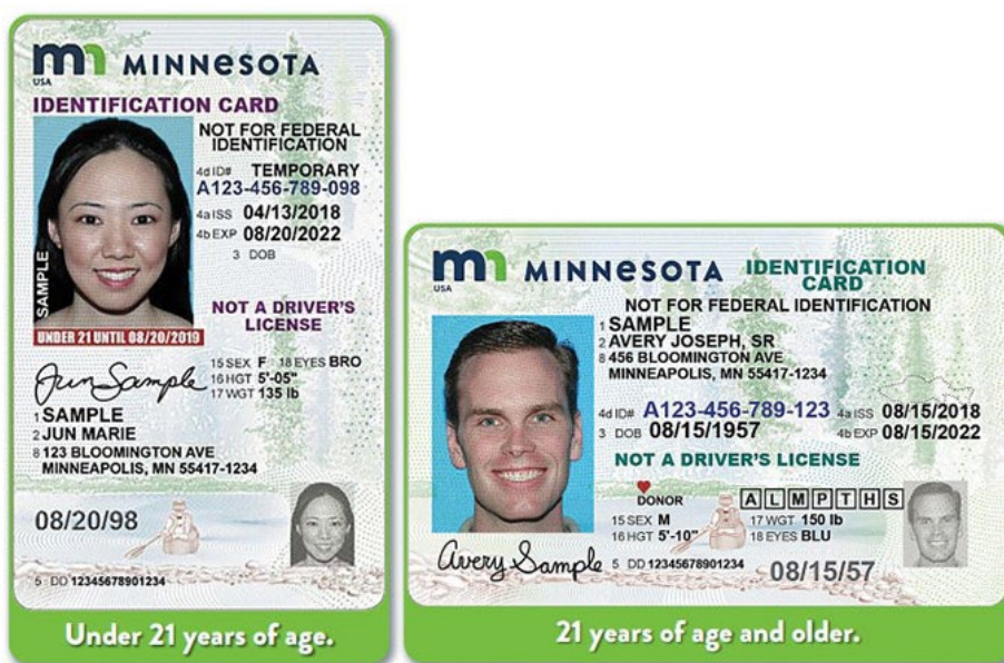
Les cartes d'identité de Minnesota

Il y a deux autres permis qui sont disponibles au Minnesota : les permis de conduire renforcés et les permis de de conduire « Real ID » (identité réelle). Pour obtenir un permis de conduire renforcé ou de « Real ID », le candidat doit prouver sa citoyenneté ou être qualifié en vertu de son statut d'immigration.