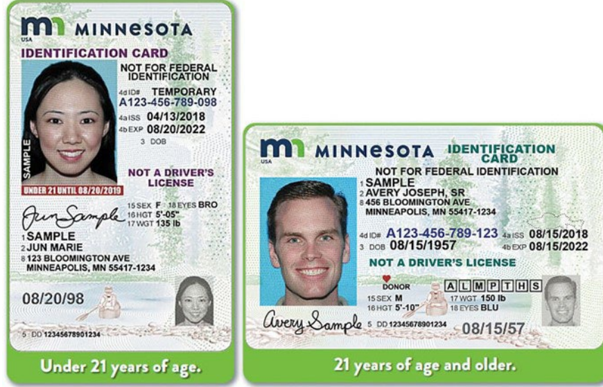
بطاقات التعريف في مينيسوتا

الرخصة المعززة ورخصة التعريف الحقيقية. وللحصول على أي من الرخصتين يجب على المتقدم إثبات أنه مواطن أمريكي أو حالة هجرة مؤهلة لذلك.